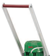
Rankinė svirtis, nereikia naudoti suspausto oro