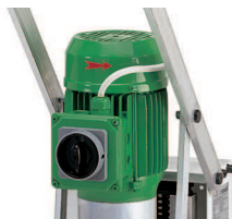
Galingas 1.1 KW variklis